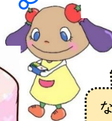
横浜すばいす弁当作りキャラクターにグリーンちゃん