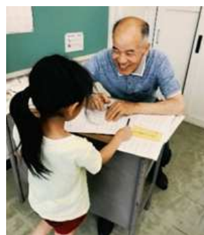
<瀬谷区内のキッズクラブでの取り組みの様子>